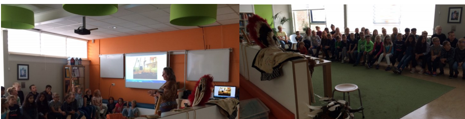
Gastles DaVinci: kosmisch onderwijs, thema Indianen